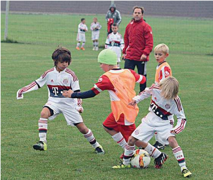
Dem Schiedsrichter Michael Zwerger entging nichts: Der FC Bayern gegen den SVA (Spielszene).

Der FC Bayern München suchte neue Gegner und fand diese beim SV Albaching